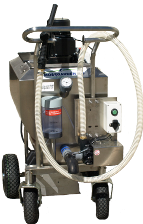
Pumpe til udfodring af mælk og vådfoder

Pumpekit med eller uden doseringskontrol. Kan eftermonteres