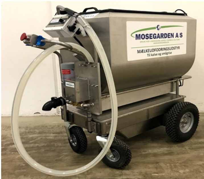
JH SPECIAL MÆLKEVOGN